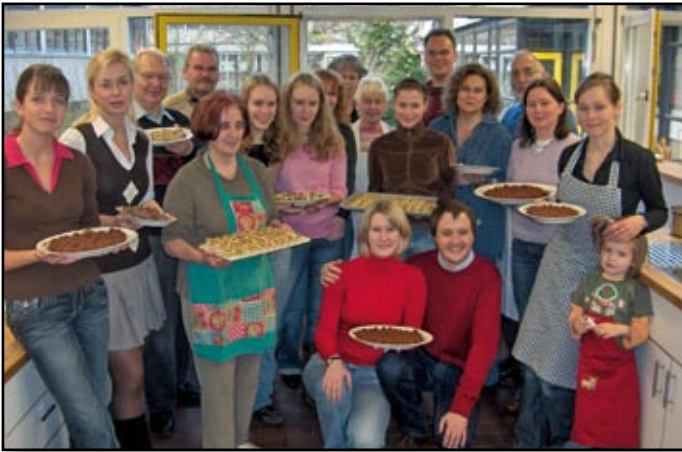
Marcos Team backt für Ehrenamtliche

Niedersachsen braucht Mindestlöhne. Jeder Mensch hat das Recht auf eine menschwürdige Arbeit und einen existenzsichernden Lohn. Menschen in Vollbeschäftigung müssen von ihrer Arbeit leben können. Deutschlandweit arbeiten mehr als 2,5 Millionen Menschen für Armutslöhne, von denen sie sich und ihre Familien nicht ernähren können. 600.000 vollzeitbeschäftigte Arbeitnehmer sind auf ergänzende Grundsicherungsleistungen angewiesen. Trotz Arbeit. Darum kämpfen wir für Mindestlöhne!