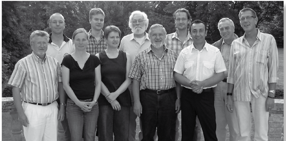
Der neugewählte Vorstand: